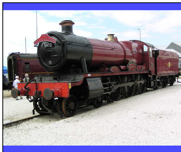
Harry Potter books