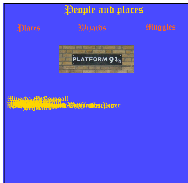
Harry Potter books